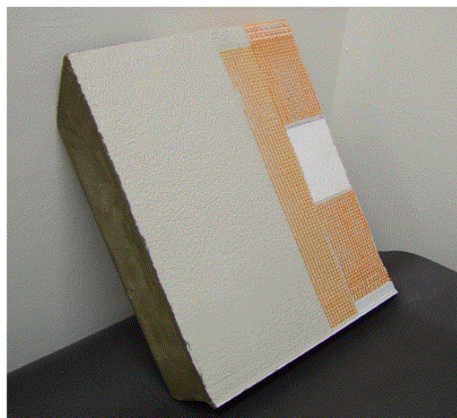
Bild 3: Schematisches Beispiel für einen geeigneten Prüfkörperaufbau.