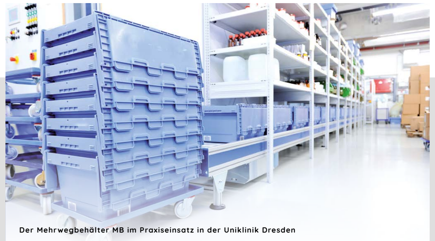
Der Mehrwegbehälter MB im Praxiseinsatz in der Uniklinik Dresden