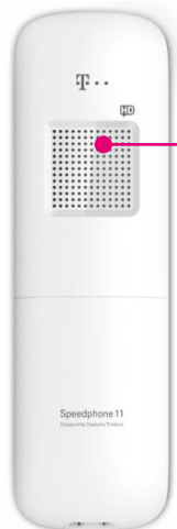
HD Voice Lautsprecher