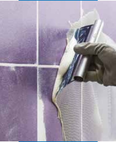
Auftragen von Ultrabond Eco MS 4 LVT Wall mit einem Zahnpachtel auf einen nichtsaugenden Untergrund