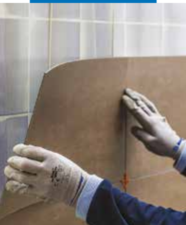
Verlegen von Designbelag an der Wand