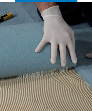
Verlegung von Nadelvlies