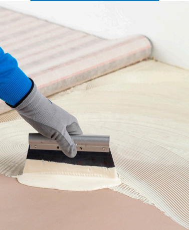
Auftrag von Ultrabond Eco TX2