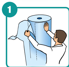
1 150 VORGESCHNITTENE BLÄTTER 1500 x 2000 mm