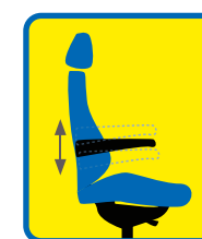
Armstütze mit Höhenverstellung