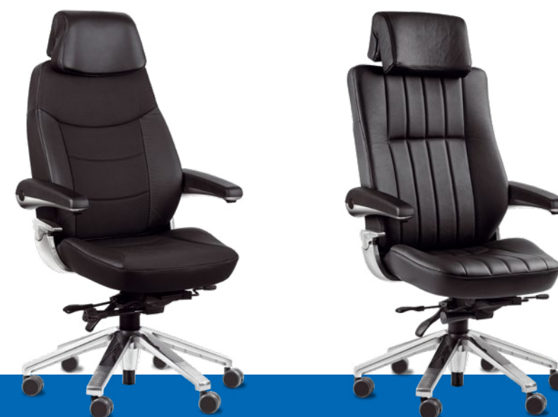
Svenstol ® S5

Selbstverständlich geht es auch beim Svenstol ® S6 vor allem um komfortables Sitzen und entspanntes Arbeiten. Deshalb sind Funktionen und Sitzkomfort wie beim Svenstol ® S5 . Nehmen Sie Platz und erleben Sie ein ganz neues Sitzgefühl. Aber immer daran denken: Überstunden bezahlt Ihnen niemand.