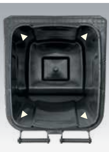
Statisch berechnete Behälterwände DU eXtra 140 und 240 L