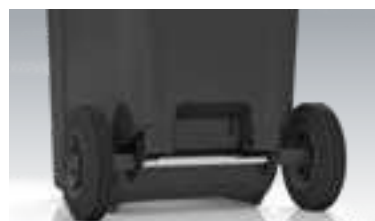
Integrierter Fußeintritt DU eXtra 180 l