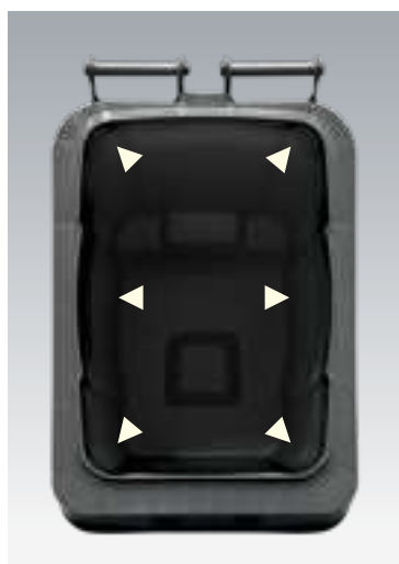
Statisch berechnete Behälterwände DU eXtra 180 L