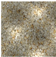
DAMTEC wave 3D