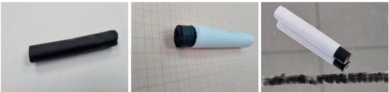
Abb. 1 Schmutz-Typ B zu einem Stift geformt (links), mit einem Papier umwickelt (mittig) und streifenförmig auf die Spiegelfliese aufgetragen (rechts) (Bilderquelle: SONAX GmbH).

Die homogene Paste wird zu einem zylinderförmigen Stift geformt und mit einem handelsüblichen Backpapier oder handelsüblicher Aluminiumfolie für die praktische Handhabung umwickelt (siehe Abbildung 1 ).