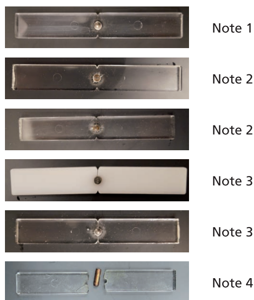
Abb. 3 Beurteilung der Spannungsrissskorrosion in Bezug auf ausgewählte Kunststoff-Arten.